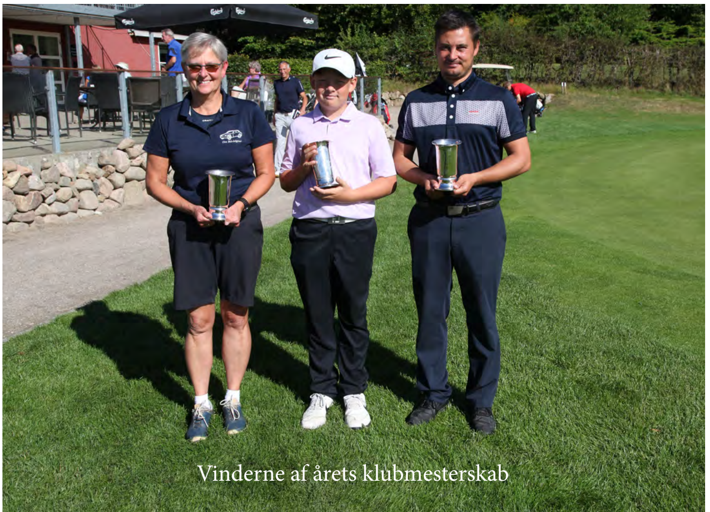
Vinderne af årets klubmesterskab

Vi er fra sæsonen 2020, hele 25 herrespillere og 10 damer, så vi er vokset ret kraftigt.